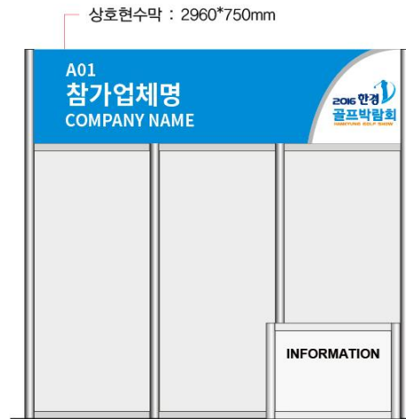
▲ FRONT VIEW