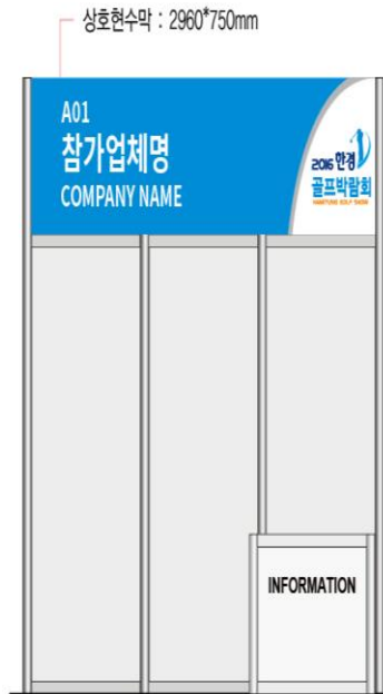
▲ FRONT VIEW