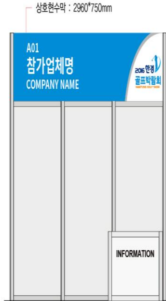
▲ FRONT VIEW